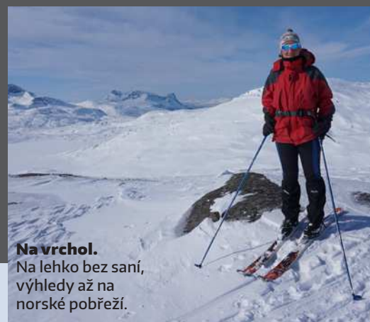
Na vrchol. Na lehko bez saní, výhledy až na norské pobřeží.

Švédské chaty jsou komfortnější a vybavenější než finské sruby, zhruba v polovině mají saunu a možnost doplnit základní proviant. O chod chat se starají srdeční chatáři dobrovolníci, které člověk stěží rozezná