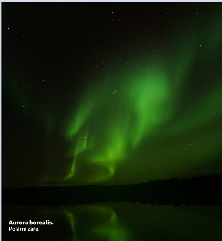
Aurora borealis. Polární záře.

dolu pokračuje až do norského Narviku, odkud je ruda exportována námořní cestou.