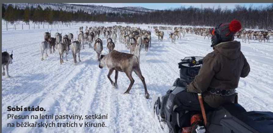
Sobí stádo. Přesun na letní pastviny, setkání na běžkařských tratích v Kiruně.

Všechny běžkařské a backcountry akce absolvujeme se saněmi, pochod s nimi je výrazně pohodlnější a bezpečnější než s batohem. I se saněmi jsme na běžkách schopni bez potíží urazit až 25 km denně,