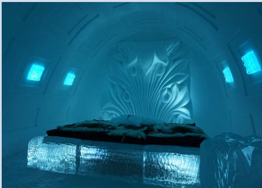
Icehotel v Jukkasjärvi. Každý pokoj je jiný.

evropana stěží uvěřitelném. Nejexotičtějším ovocem je oranžový ostružiník moruška, rostoucí v bažinách (nejjižněji se jako přísně chráněná rostlina vyskytuje na hřebenech Krkonoš). Podzim přichází mnohem dříve než v Česku, příroda se neuvěřitelně zbarví, dozrávají brusinky, začne se objevovat polární záře a muži se vydají na lov.