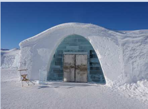
Ledové království. Icehotel Jukkasjärvi.