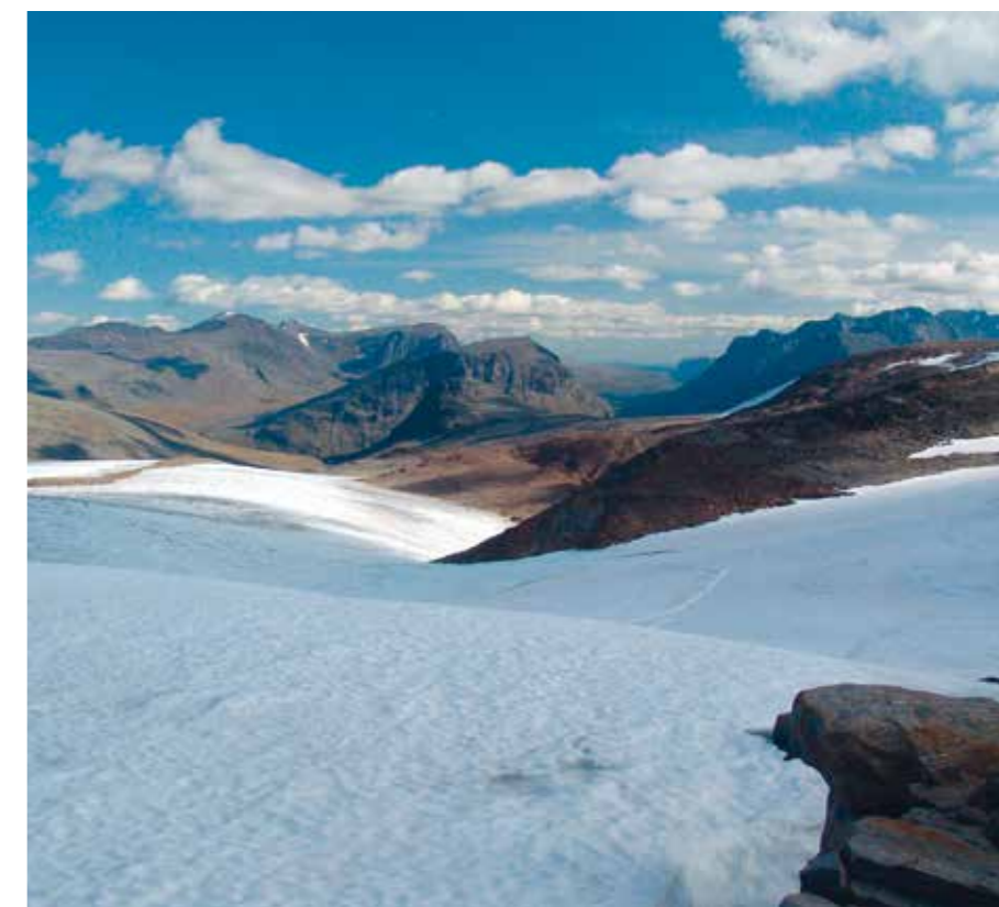
Ledovec Oarjep Oalgásjiegna

Sarek je jedním ze čtveřice parků společně tvořících jednolitý celek, který je největším komplexem národních parků Evropy. Na švédské straně to jsou NP Stora Sjöfallets a NP Padjelanta a v Norsku NP Rago. Současná rozloha samotného NP Sarek je 1977 km 2 . Národní park byl vyhlášen již v roce 1909, a je tak nejstarším parkem Evropy. O vyhlášení parku se zasloužila skupina vědců z Uppsalské univerzity, mezi nimi i nejznámější švédský polární badatel, profesor mineralogie a geografie Axel Hamberg. Jeho jméno nesou ledovce i v Grónsku, na Svalbardu a Antarktidě. Osobně byl v Sareku pětadvacetkrát a má i zde svůj vrchol, Sarek považoval za své celoživotní dílo. Roku 1911 vystavěl observatoř na masivu Párte v 1880 metrech, na které působil i Finn Malmgren, spolupracovník Františka Běhounka (zahynul při katastrofě vzducholodi Italia roku 1928).