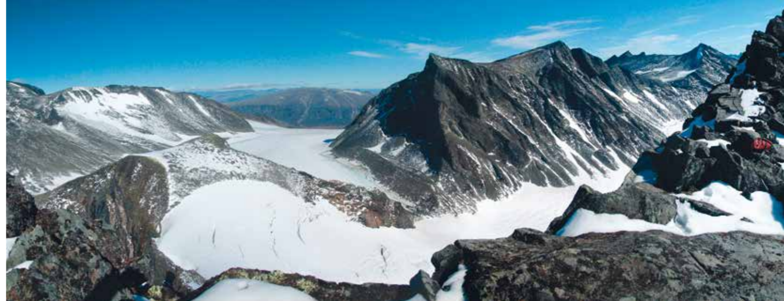
Na vrcholu Svarta Spetsen, 1820 m

SEK a podélně, do centra parku, 500–600 SEK na osobu. Pro kratší přejezd na magistrále Kungsleden je možné využít i veslice a přejet svépomocí. Používá se tu systém tří lodí, z nichž jedna je vždy na opačném břehu. Tento staletí starý systém funguje i na několika dalších místech švédského Laponska. Většina turistů se přesto nechává převézt, přejezd je víc než kilometr dlouhý na otevřeném jezeře, kde bývá velmi větrno. Poslední možností je využít služeb místní vrtulníkové společnosti, ale i zde platí omezení, že přistát je možné pouze na hranicích parku, samotný Sarek je bezletovou zónou a rezervací UNESCO „Laponia“. Předpisy okolních parků jsou o něco mírnější, díky tomu smí vrtulník přistát na několika místech NP Padjelanta a Stora Sjöfallets, ale nikdy nesmí vletět do Sareku, jen na jeho hranice. Omezení se zdají být velmi přísná, ale opravdu je co chránit. Sarek je unikátní nejen v evropském, ale i celosvětovém měřítku. Kdo chce zažít poslední absolutní divočinu v Evropě, měl by se vypravit právě sem.