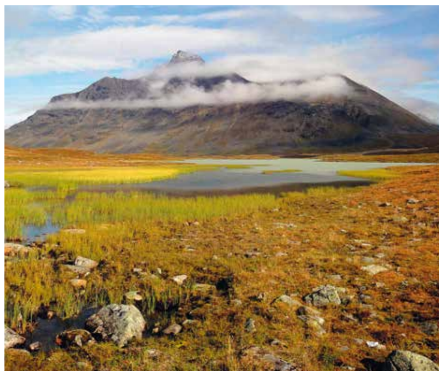
Vrchol Bierikbakte, 1789 m

Nejunikátnějším a současně největším údolím je Rapadalen, mezi turisty pověstný prodlíráním džunglí a broděním bažinami, za vyššího stavu vody je zcela neprůchozí. Rapadalen neustále přetváří řeka Ráhpáadno, která ve svém ústí do jezera Laitajaure vytváří množství jezer, propojených kanály a močály. Pohled od chaty Aktse na břehu jezera se siluetou útesu Skierffe právem nese jméno „Brána Sareku“. Eroze zde do-